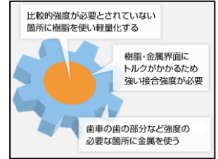
歯車の軽量化 材料の一部を樹脂に置き換えて軽量化