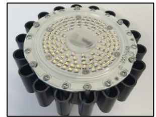
LED部品の耐熱対策 放熱特性を最大限に発揮