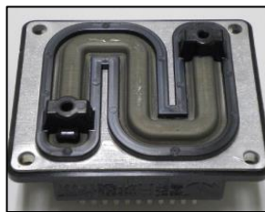
ウォータージャケットの軽量化 車載部品の軽量化