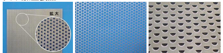
丸穴パンチングメッシュ(SUS304) 左：板厚0.5mm×板幅300mm×穴径1.8mm 右：板厚0.5mm×穴径1.2mm 異形状パンチングメッシュ スチール(板厚：0.6mm)